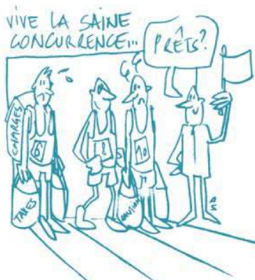
La concurrence est-elle loyale ? Suite (PA n°30)